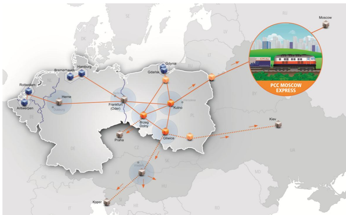
Rys: Sieć regularnych połączeń intermodalnych PCC Intermodal S.A.

Kolejnym krokiem zapowiadany przez PCC Intermodal S.A. będzie uruchomienie regularnego połączenia w korytarzu transportowym Bałtyk-Adriatyk. Pierwszy pociąg w kierunku Sopronu ruszy jeszcze wiosną bieżącego roku. W ciągu najbliższych kilkunastu miesięcy spółka planuje również rozbudowę hubu w centralnej Polsce oraz modernizację i inwestycje w park maszynowy terminali na Śląsku. Jeszcze w tym roku firma przedstawi koncepcję budowy suchego portu na Pomorzu, (realizacja tej inwestycji jest planowana na 2015 rok). W związku z rozwojem połączeń na wschód Europy, firma zamierza zainwestować w infrastrukturę terminalową na wschodniej ścianie Polski.